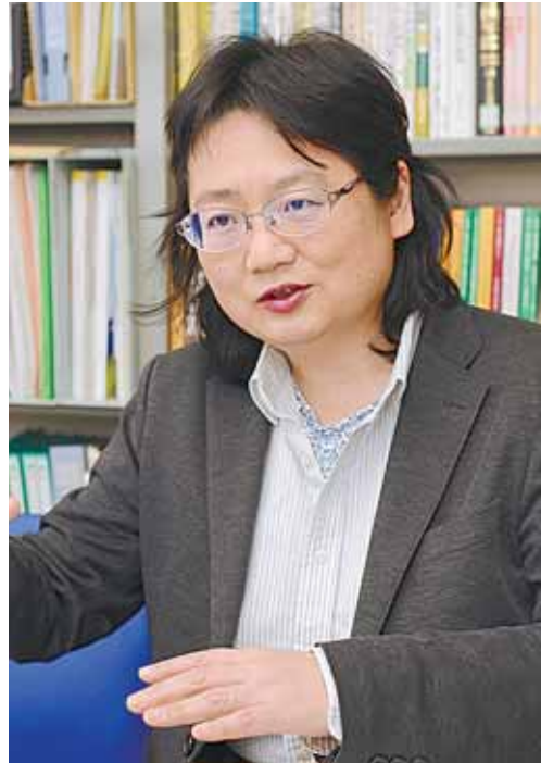
インタビュー 教授 上西 充子氏

法政大学大学院 キャリアデザイン学研究所 キャリアデザイン学部 教授 上西 充子氏